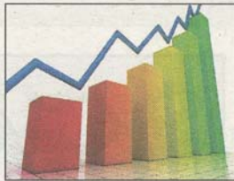
Trotz Wirtschaftskrise expandiert das hamano consulting und erweitert sein Geschäft auf die Kanarischen Inseln

jekte, die Spaß machen. Die hamano ist seit Juni diesen Jahres zertifiziertes Partnercenter der DDM Deutschen DialogMarketing. Die DDM mit Sitz in München und Berlin ist ein in der deutschen Vertriebs- und Callcenter-Landschaft seit Jahren bekannter Produkt- und Systemgeber. Das Zertifikat gewährleistet, dass das Call Center keine unerlaubte